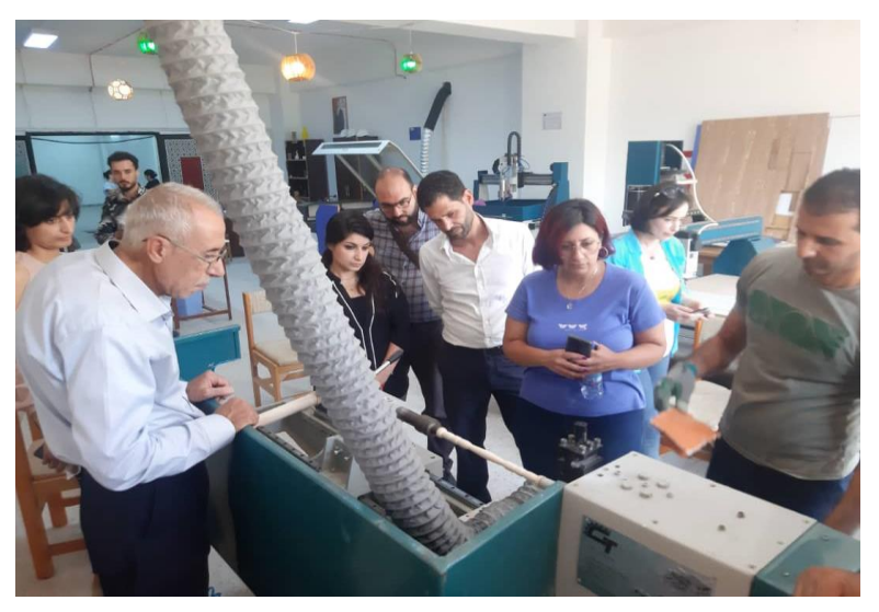
2<sup>nd</sup> day of training