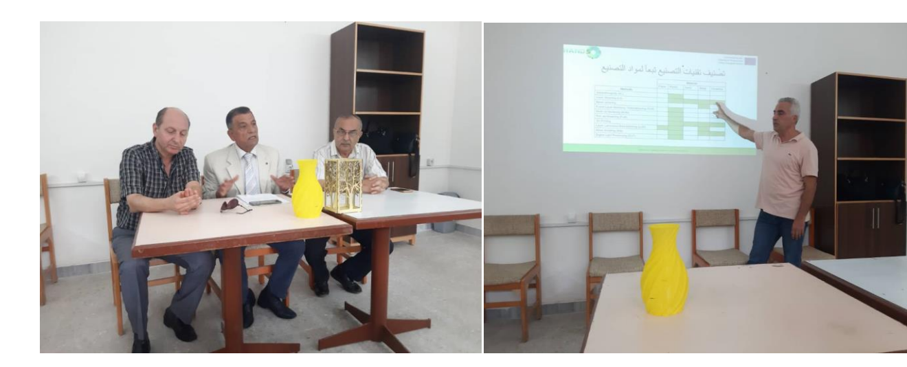
1st day of training