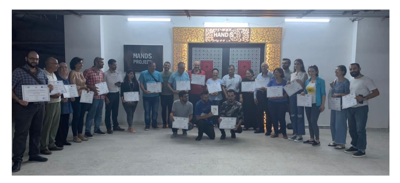
3<sup>rd</sup> day of training